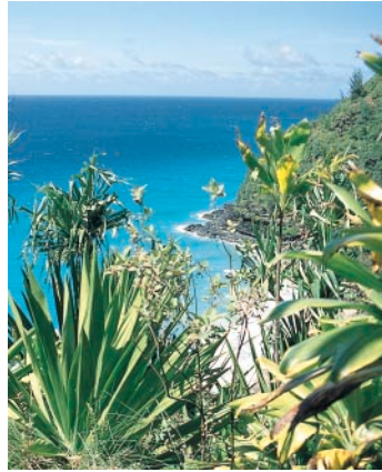
Die zweite Etappe geizt nicht mit ihren Reizen.

Hanakapiai Beach – Hanakoa Valley (6,4 km/4mi.): Nach der Bachüberquerung des Hanakapiai Stream bleiben wir auf dem Hauptweg, der allerdings nicht ganz einfach zu finden ist: viele kleine Seitenpfade, die zu den verschiedenen Campingplätzen führen, sorgen in dem dicht bewachsenen Tal für Verwirrungen. Wir kommen an den ungepflegten und nicht einladenden Trockentouletten vorbei und steigen anschlie-