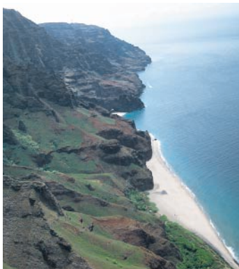
Das Ziel – vom Helikopter aus betrachtet.

Ausgangspunkt: Parkplatz an der Kee Beach.